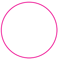
Bodenmarke außen Bottom outside print Ø 25 mm