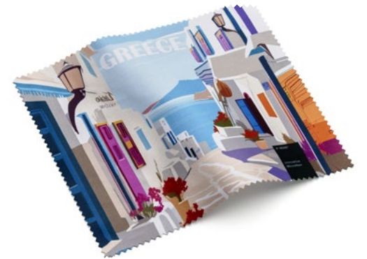
Ansicht des fertigen Brillentuchs