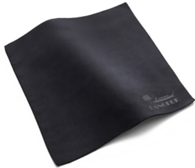
Ansicht des fertigen Prägetuchs mit Saum